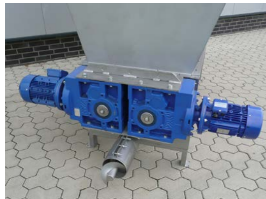
Direktantrieb der Zerkleinerungswalzen